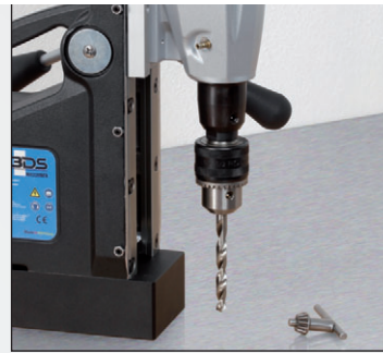
3. Einsatzbereit für Spiralbohrer.