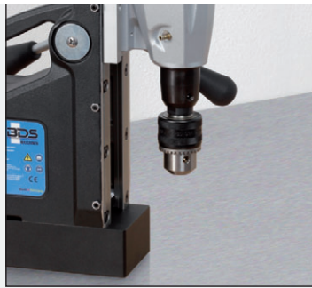
2. Bohrfutter in die Direktaufnahme einsetzen.