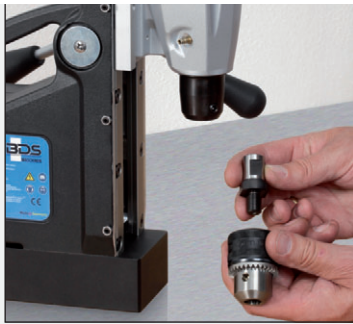
1. Adapter mit Bohrfutter verbinden.