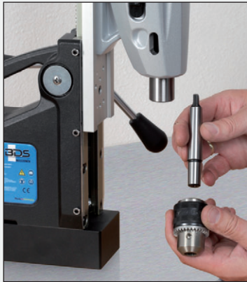
1. Kegeldorn mit Bohrfutter verbinden.

ZSI 113 1/2" x 20 NF 1 - 13 mm ZSI 116 1/2" x 20 NF 3 - 16 mm