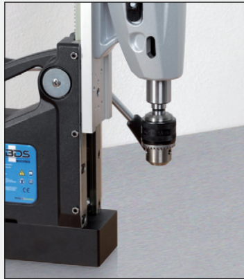
2. Bohrfutter in MK-Aufnahme einsetzen.