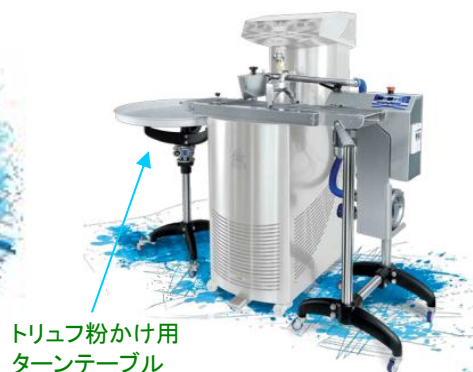
トリュフ粉かけ用 ターンテーブル